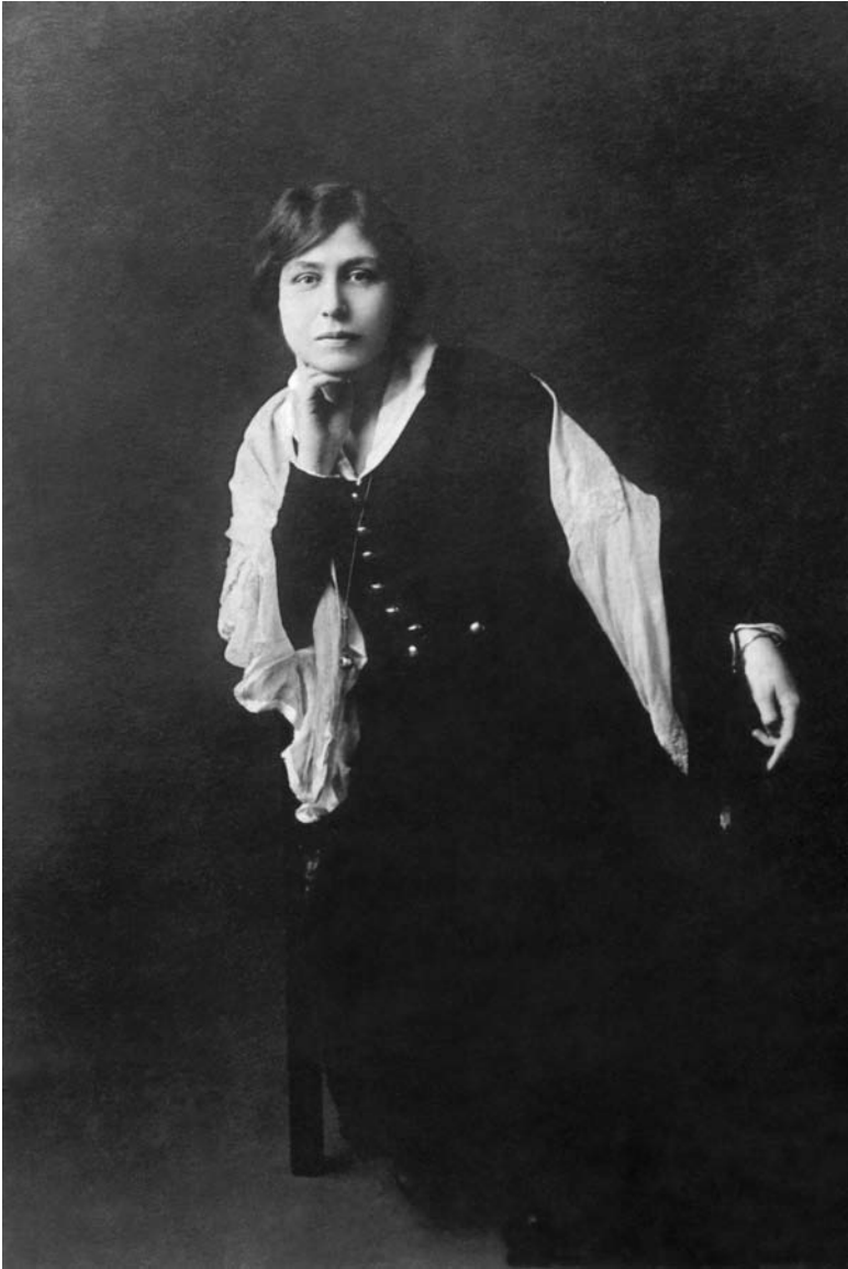
La Mère à Tokyo en 1917